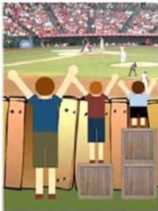
'Iedereen zo behandelen dat de mogelijkheden gelijk zijn'