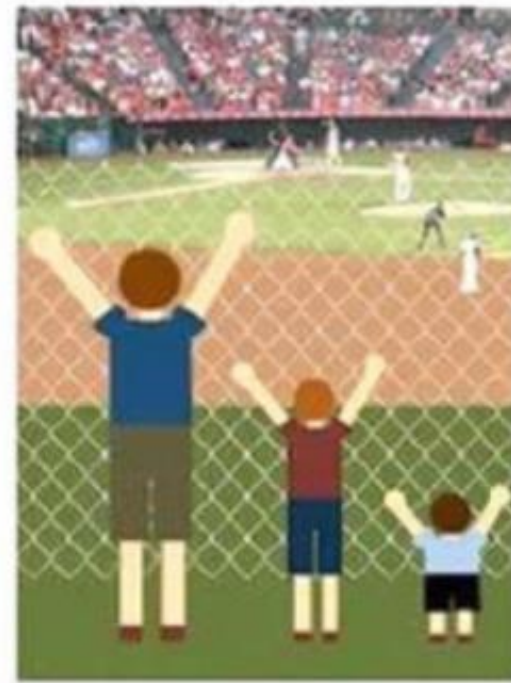
'Nieuwe oplossing: algemeen toegankelijk voor iedereen!'