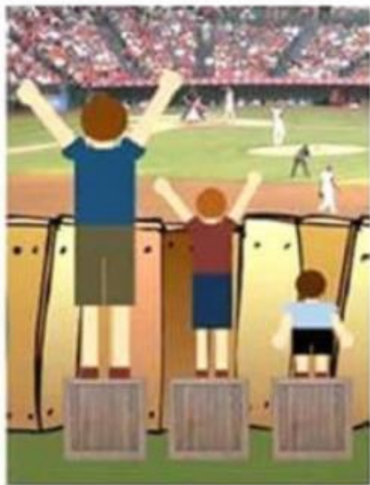
'Iedereen gelijk behandelen'